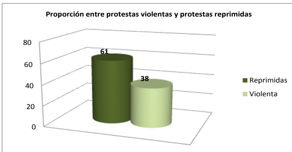
Gráfico 3: Protestas de carácter violento y protestas reprimidas

Las protestas de vecinos, en sus comunidades, las de estudiantes y las de damnificados son las más reprimidas por los cuerpos de seguridad del Estado. Como principal organismo represor se encuentra la Guardia Nacional Bolivariana de Venezuela en el 37% de los casos. En segundo lugar, se encuentra la Policía Nacional Bolivariana con 17% y en tercer lugar, la Policía de Aragua (12,31%).